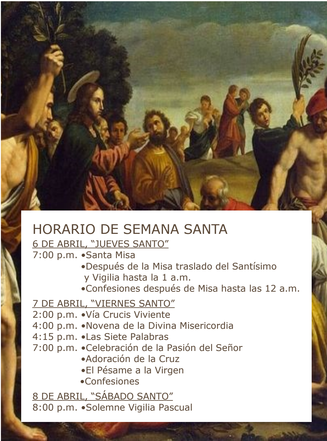
Entrada a Jerusalén, Hippolyte Flandrin, 1842

“LA IGLESIA MADRE DE LOS HISPANOS EN CHICAGO”