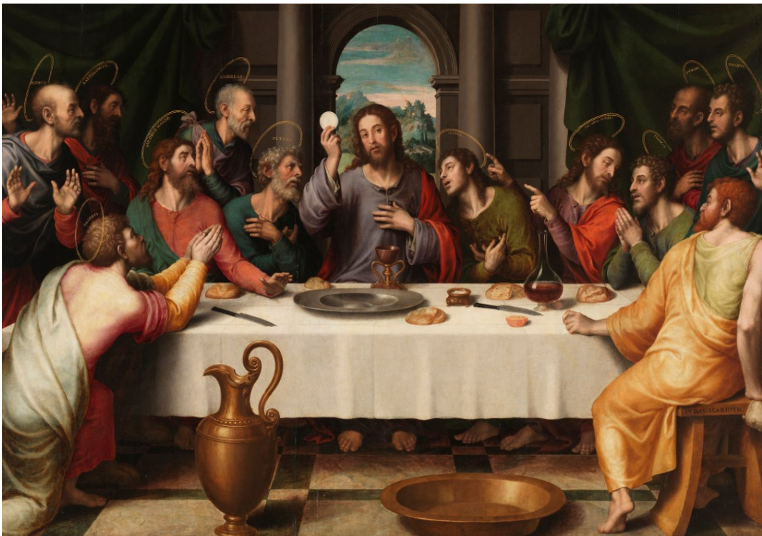
Juan de Juanes 1523 – 1579 The Last Supper (1560)