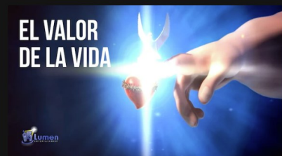
El valor de la vida