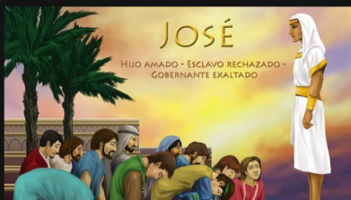
José: Hijo amado, esclavo rechazado, gobernante exaltado