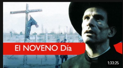
El noveno día