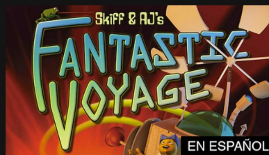
El viaje fantástico de Skiff y Aj