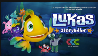
Lukas Storyteller - Español