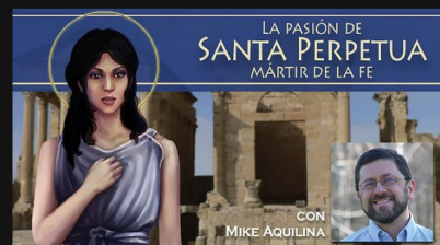
La pasión de Santa Perpetua, mártir de la fe