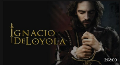
Ignacio de Loyola