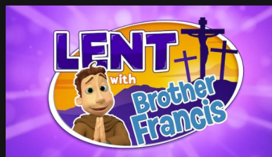
La Cuaresma con El Hermano Zerferino