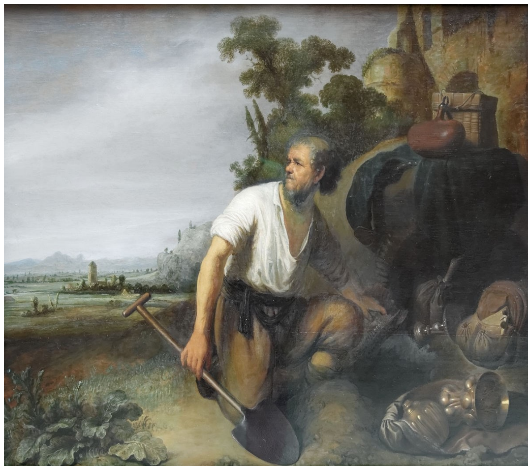
Parábola del tesoro escondido de Rembrandt (c. 1630).

En aquel tiempo, Jesús dijo a la multitud: "El Reino de los cielos se parece a un tesoro escondido en un campo. El que lo encuentra lo vuelve a esconder, y lleno de alegría, va y vende cuanto tiene y compra aquel campo.