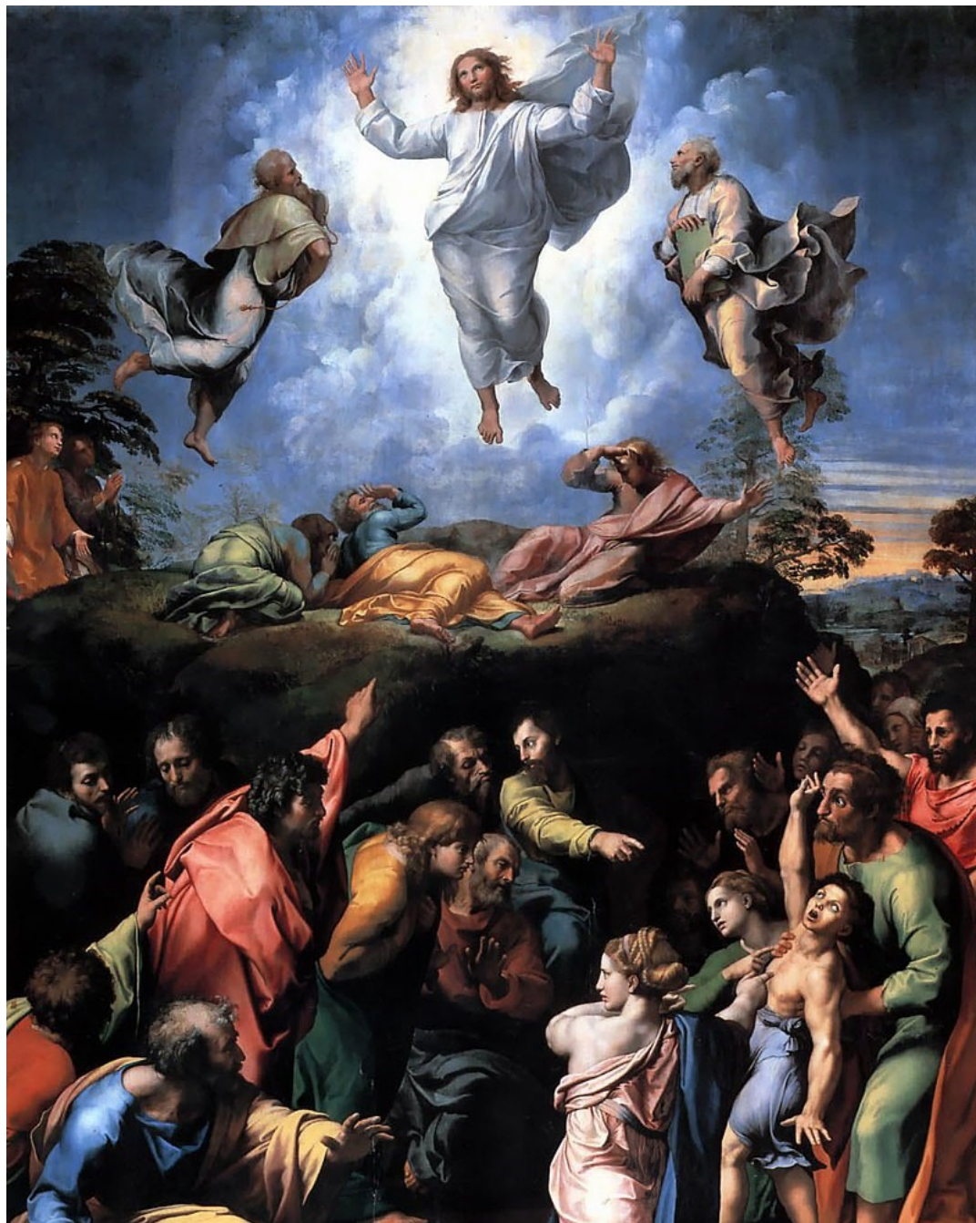
La Transfiguración por Raphael, c. 1520

Domingo de la Transfiguración del Señor, 6 de Agosto, 2023